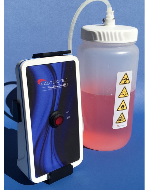
Liquid-Pumpe mit 2 Liter Flasche