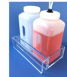
Flaschenset Thermo 2x4 Liter, inklusive Aerosolschutz Nr. 700045