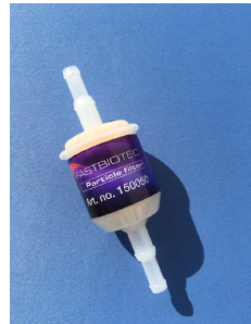
Partikelfilter Nr. 150050 1 VE 10 St.