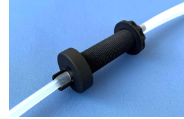
Aerosolschutz Thermo Nr. 160025