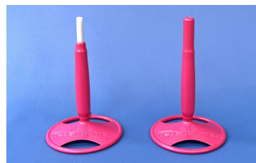
Nr. 600081 Tips 1000 µl und Pasteur