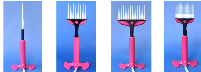
Nr. 600073 Nr. 600078 Nr. 600012 Nr. 600016 Absaugpipetten 1-Kanal, 8-Kanal, 12-Kanal, 16-Kanal