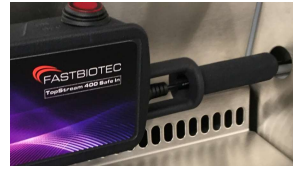
Halterung Thermo Herasafe Nr. 600450