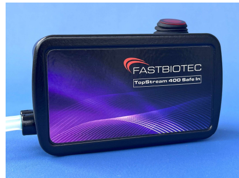
Liquid-Pumpe TopStream 400 Safe In, mit Schlauchset und Partikelfilter Artikel-Nr. 600400