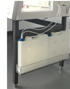
Tankset Thermo 2x5 Liter, inklusive Aerosolschutz Nr. 700052