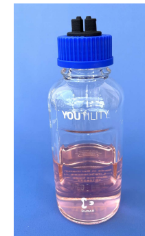
Absaugdeckel GL45 Nr.600610